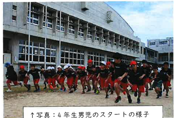
↑写真：4年生男児のスタートの様子

令和6年度の「校内持久走大会」が2月18日の授業参観日に合わせて行われ、1年生から6年生までの全校児童がこれまでの練習の成果を発揮し健脚を競いました。薄曇りの肌寒い中の実施となりましたが、保護者の皆さんの声援を受け、全力で精一杯走る姿がたくさん見られました。やはり、保護者の応援は子供たちにとってパワーの源であることを改めて感じる大会となりました。