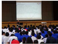
入部生徒全員での集会