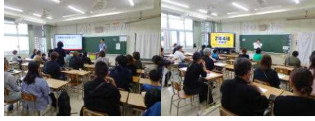
学級保護者会の様子