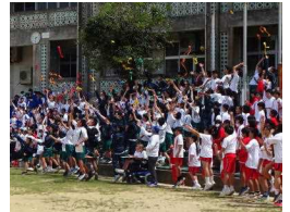
締めめのセレモニー