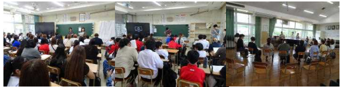
各部に分かれて活動についての話し合いを行いました