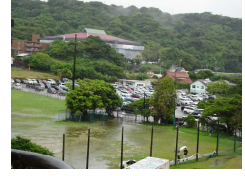
駐車場は満車でした