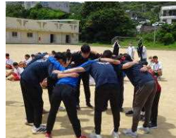
リレー職員チーム