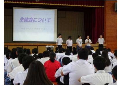
生徒会について説明する生徒会役員

4月10日に1年生を対象に生徒会入会式が行われました。入会式では「自分たちで学校をつくる」というテーマのもと、生徒会という組織についての説明が生徒会役員によって行われ、「生徒自らが話し合い、自分たちで考えていい学校をつくっていきましょう」という生徒会役員の想いが1年生に伝えられました。本校では、生徒を主体とした学校づくりに取り組んでいます。「生徒のために、生徒自らが考え、生徒自らが行動し、生徒自らでつくる学校」の構築に向けて、生徒会役員の皆さんのリーダーシップと本校生徒全員の取り組みに期待しています。