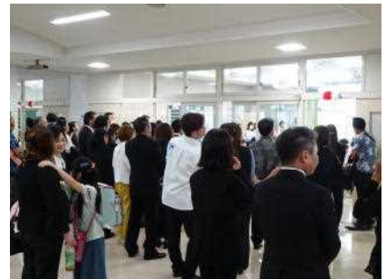
学級開きを多くの保護者が参観しました