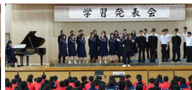
有志合唱(全力少年)