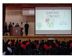
生徒会による学校紹介