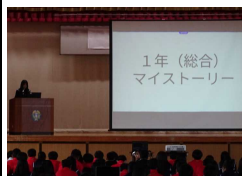
1年発表(マイストーリー)