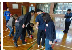
スポーツ交流会(ボッチャ)