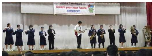
吹奏楽とギター演奏