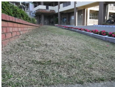
草刈り・芝の管理