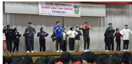
学校職員によるダンス