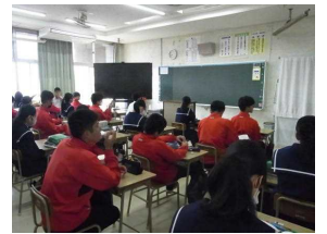
ノーチャイムで授業開始を待つ生徒

生徒会の提案で、12月2日からノーチャイムでの学校生活に取り組んでいます。これは、本校の凡事徹底事項の一つである「時を守る」に関連した取り組みです。各自で時間を確認したり、お互いに声をかけ合って授業開始前に着席し授業開始を待つ生徒の姿が定着しつつあります。各自がそれぞれ時間を意識して行動することで学校生活への意識の高まりや集団としての一体感が生まれています。生徒会の取り組みで学校生活の改善が進んでいます。