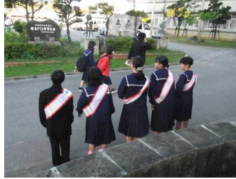
朝の選挙活動の様子

12月9日に生徒会役員選挙が行われます。今回は6名の生徒が生徒会役員に立候補しています。9日の選挙に先だって立候補者の選挙活動が12月3日から始まっています。朝の会や給食時には立候補者の演説が電子黒板で全教室に配信されました。どの立候補者も自分の考えを力強く主張し、教室の生徒は立候補者の演説を真剣に聴いていました。