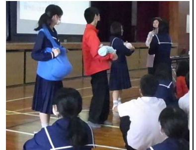
妊婦体験、赤ちゃんだっこ体験