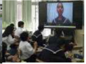
給食時間のオンライン選挙演説