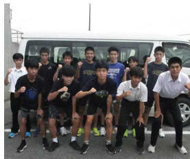
試走出発前の男子チーム

地区駅伝競争大会に向けて、男女駅伝チームを結成し、本番に向けて選手、スタッフ共に練習に頑張っています。駅伝チームの男女キャプテンに目標を聞いたところ、男子はベスト4に入り県大会（八重山大会）に出場すること、女子は8位入賞だそうです。努力が報われ、目標が達成できることを願っています。地区駅伝競争大会は10月26日に糸満市の平和創造の森公園で行われます。保護者の皆様応援よろしくお願いいたします。