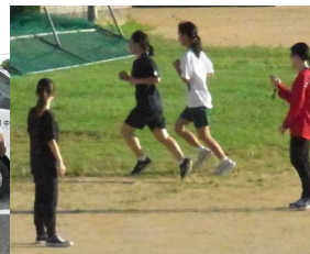
朝練中の女子チーム