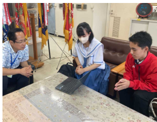
校長と生徒会役員との意見交換(9/11)

9月26日にオンライン生徒会朝会を行いました。主な内容は、1学期に実施した生徒会による生徒・職員へのアンケート（節電をねらいとする、体育着登校について）の結果説明とその結果を受けての取り組みについてです。生徒会としては体育着で学校生活をすごしエアコンの設定温度を上げることで節電できると考え、実施に向けてアンケートをとりましたが、アンケートで様々な課題が指摘され、今回の実施は難しいと判断し、学校の節電は別の方法で取り組んでいくということでした。また、節電と併せて節水とあいさつの奨励についても取り組んでいきたということでした。これは、生徒会朝会を実施する前に生徒会役員が校長との意見交換の中で提案してきた内容で本校の課題でもあります。2学期も生徒会を中心とした「生徒自らがつくる学校」への取り組みを推進していきます。