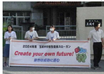
あいさつの奨励に取り組む生徒会役員(10/3)