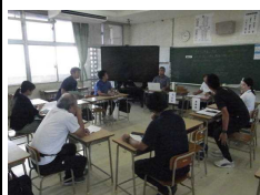
各教科部会の様子