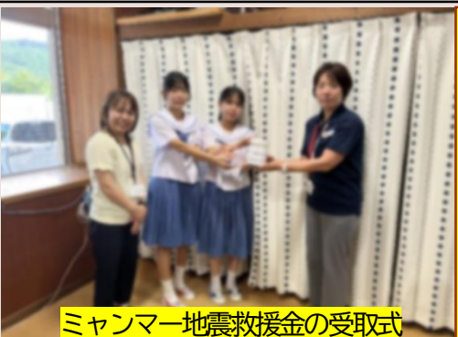
ミャンマー地震救済金の受取式

生徒会ボランティア委員会を中心に取り組んだ「ミャンマー地震救済金」を日本赤十字社沖縄県支部の方に手渡しました。