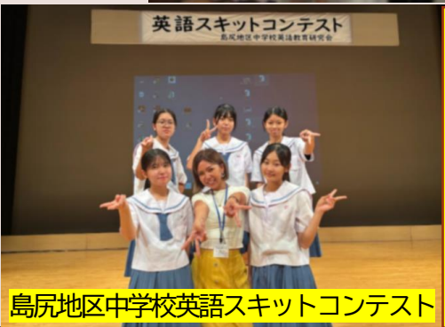
島尻地区中学校英語スキットコンテスト

生徒会「〇〇TRY」を紹介する第3回は「委員会TRY」です。生徒会の11専門委員会が、年度初めに掲げた目標と具体的な取組内容を可視化して、全校生徒と足並みを揃えた実践を展開しています。