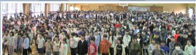
4年生の皆さんが3学期の抱負を発表しました。

始業式の今日は、各学年ともゆったりとしたペースで始めました。グループですごろくをしたり、学級全体でゲームをしたり、担任も含めみんなでたくさんユンタク(おしゃべり)をしながら3学期をスタートしました。短い学期でも充実した日々になるようにしていきたいですね。