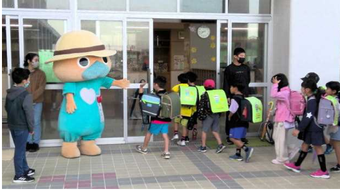
なんじいがあいさつ運動に来ました(12/19)

年明け、1月11日（木）に校内マラソン大会を実施します。大会に向け、毎日のお昼休みの運動場には練習に励む児童でいっぱいです。昨年より1つでも順位があげられるよう冬休みも練習に取り組んでみましょう。