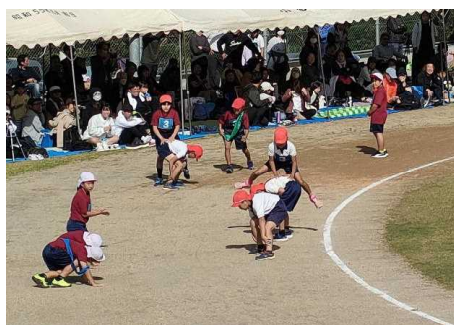
チャンプルーリレー(3年)