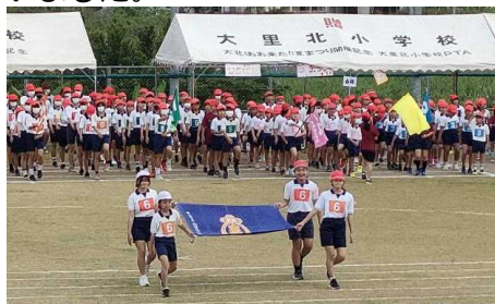
開会式入場(全校児童)

11月12日(日)から延期となっておりました運動会でしたが、19日(日)に無事開催することができました。前週とはうって変わって好天にも恵まれ、楽しい運動会となりました。2週にわたりお弁当の準備にご負担をおかけしてしまった皆様には申し訳なく思いますが、今年度の反省を次年度に結び付けたいと思います。温かいご声援を送ってくださった皆様、一緒にご参加いただき盛り上げてくださった皆様ありがとうございました。