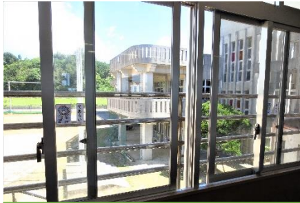
全て常時20CM開けている窓