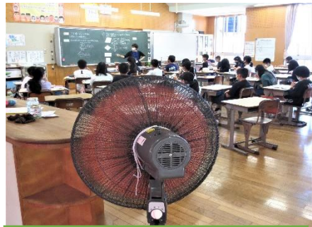
対流を起こす大型扇風機