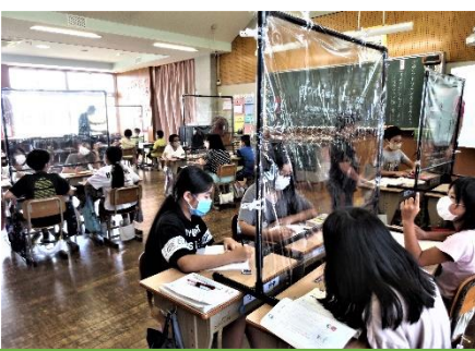
シールドを置いての話し合い