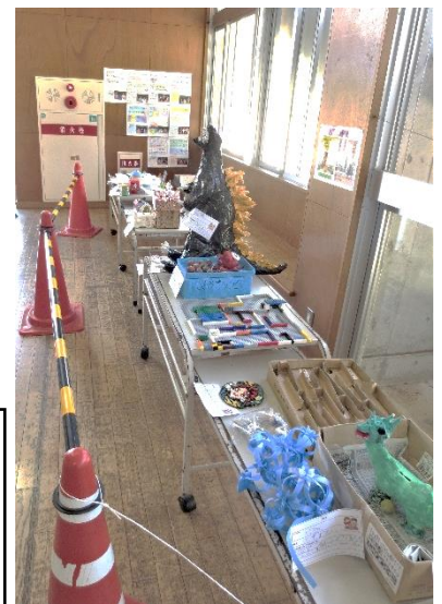
夏休みの作品(2年生)

今週、1年生は欠席する子もなく元気に登校してくれました。落ち着いて学習に取り組んでいます。来週からも頑張ってもらいたいと思います。