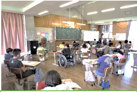
極力離れた児童間の席の距離