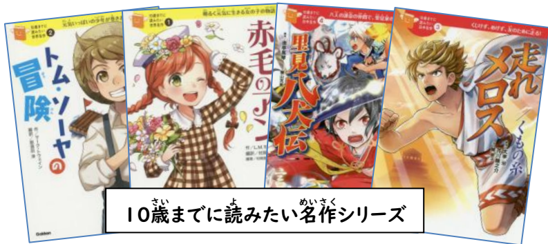
10歳までに読みたい名作シリーズ

11月の読書目標は、「 めいさくよ 名作を読もう」です。世の中には ほん たくさん めいさくよ の名作と呼ばれる本があります。読みたい本が見つからない人や、 ほん 新しい本に挑戦してみたい人は、ぜひ読んでみてください。