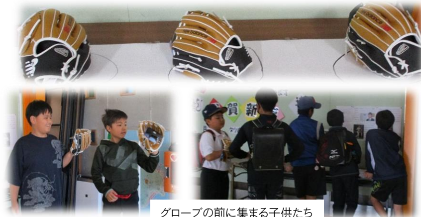
グローブの前に集まる子供たち

** 当たよりの記事について、無断転載・無断引用は個人情報保護の観点からご遠慮ください。 **