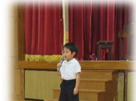
転入生の紹介 元気よくあいさつをしました。