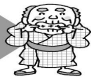
むし歯の治療がまだの人 (人)