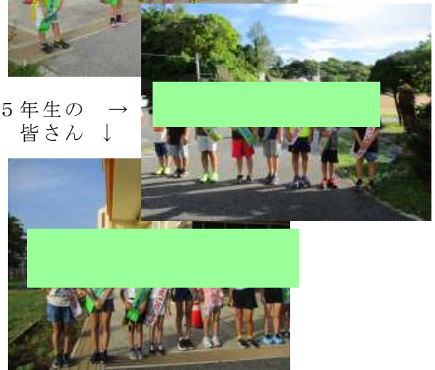
5年生の → 皆さん ↓