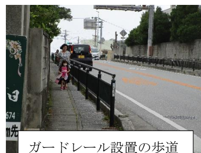
ガードレール設置の歩道