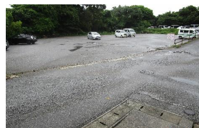
J A知念支所駐車場で降車