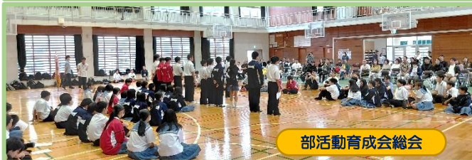
部活動育成会総会