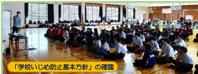
「学校いじめ防止基本方針」の確認