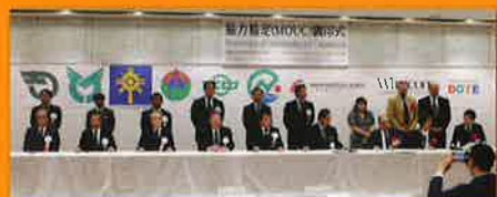
留学先の大学と協力協定(MOUC)を締結