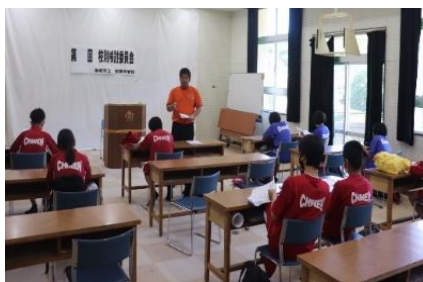
第2回校則検討委員会

みんなが安心・安全な生活をおくるために・・・知念中に関わるすべての人が納得する校則であるために・・・