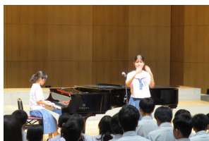
#全体指揮者 &amp; 伴奏者