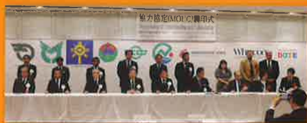
留学先の大学と協力協定(MOUC)を締結