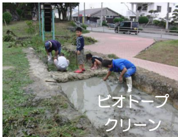
ピオトープ クリーン