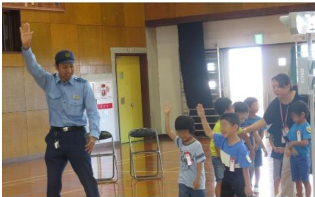
スマホ版ホームページ画面