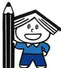
イメージキャラクター おほんちゃん

「読書感想文をどうやって書いたらいいかわからない」 「どんな本を読んだらいいかわからない」 そんな声にお答えします。 さあ、読書感想文にチャレンジしよう！