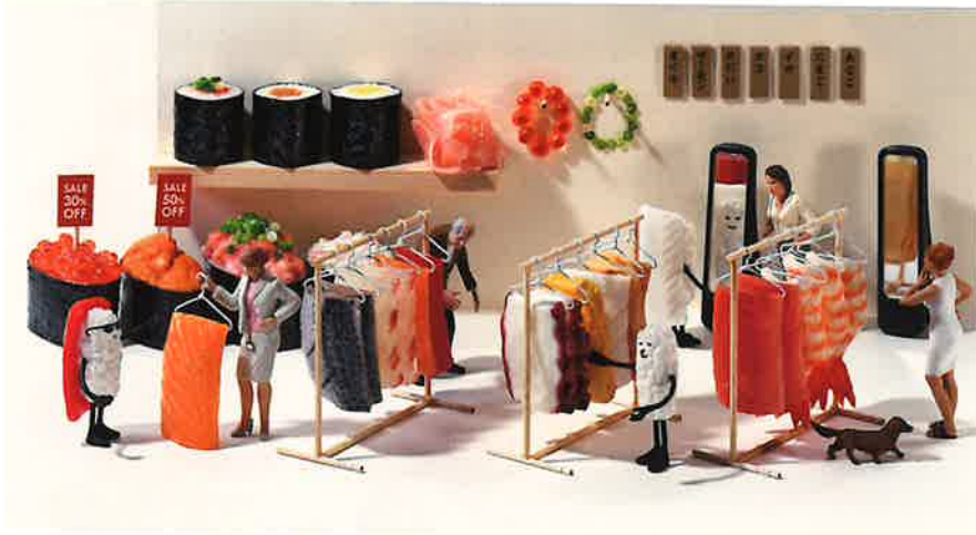
おすしがふくを かいにきた