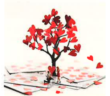
プロポーズの切り札