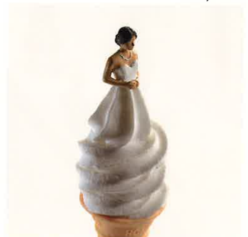
アイスすることを誓います