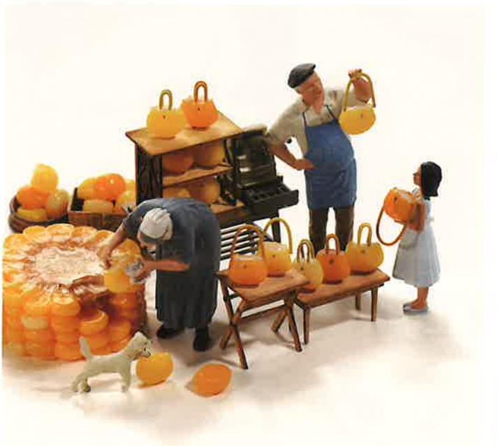
コロンなバッグはいかがでしょう？