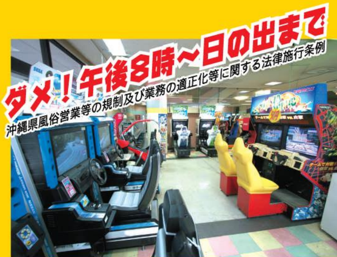
ゲームセンター ※一部は午後10時~午前4時まで

※興行場等とは、映画館、演劇場、ボウリング場、ビリヤード場、スケート場、ゲームセンター、カラオケボックス、インターネットカフェ、マンガ喫茶などをいいます。