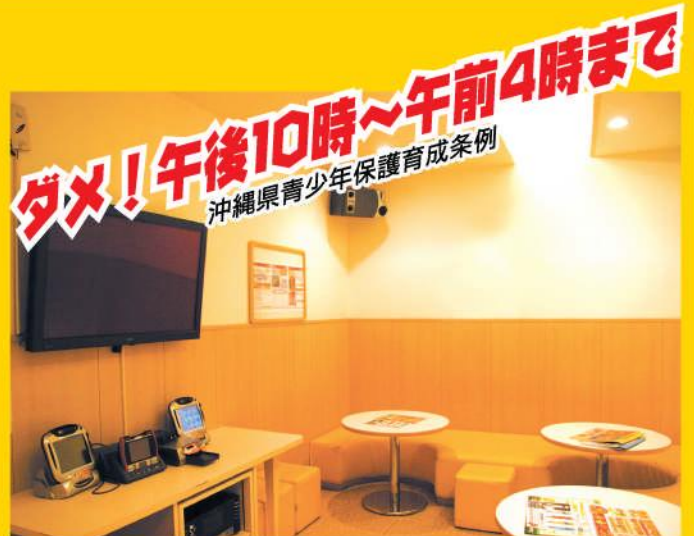
カラオケボックス