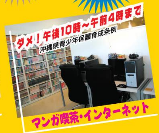
マンガ喫茶・インターネット

そのほか、深夜営業のコンビニ、飲食店を含め、全ての県民には青少年の深夜のはいかいを防止する努力義務があります。