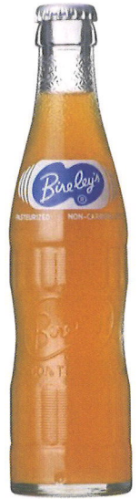
1970年代の 沖縄バヤリースオレンジ