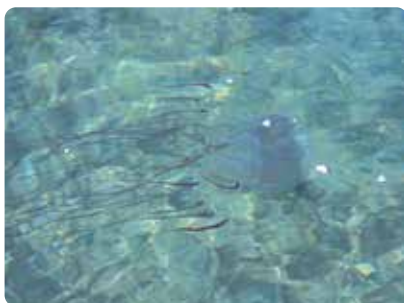
ハブクラゲが見えるかな？

沖縄の海のいろいろな場所において、深さ50センチほどの浅い場所でも泳いでいます。ハブクラゲは半透明なので、海の中ではなかなか見かけません。