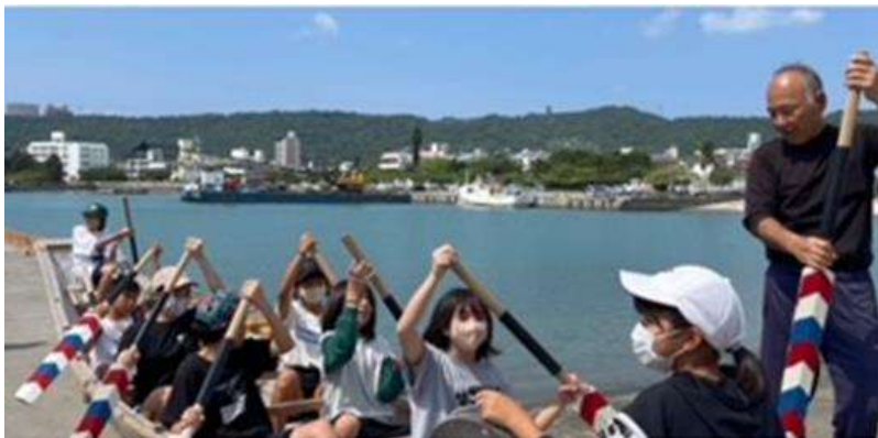
馬天小6学年 春の遠足 馬天にて ハーリー体験と馬天 港の歴史を学習