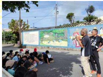
百名小5学年総合学習 稲作養蚕の地として保全活動に 取り組む地域の方々と 座学&フィールドワーク