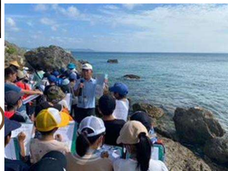
知念小 4学年 総合学習 南城市史跡 めぐり