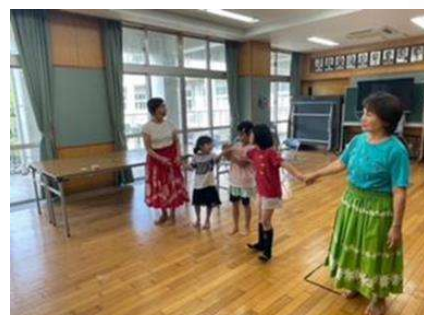
放課後こども教室 フラダンス・手話など 地域サークルの方々との活動