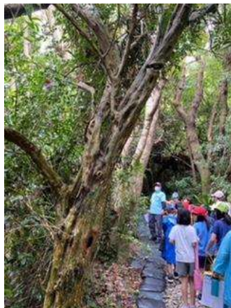
知念小 3学年 総合学習 せーふあうたき 自然観察