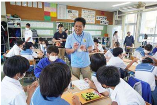
知念中2学年総合学習 南城市観光協会さんと商品開発へ 向けた課題解決学習 (PBL)