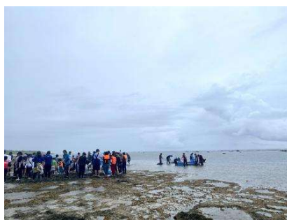
久高小中学校 追い込み漁